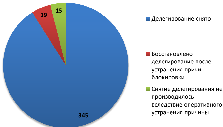
Рис.3 Итоги обработки обращений о снятии делегирования (июль 2018)

За отчетный период по обращениям компетентных организаций были сняты с делегирования 364 доменных имени. Для 15 доменных имен снятие делегирования не потребовалось вследствие оперативного устранения причин блокировки администратором домена (или ресурс был заблокирован хостинг-провайдером).